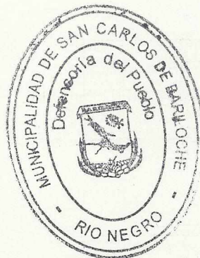
ANALÍA WOŁOSZCZUK Defensora del Pueblo San Carlos de Bariloche ORD. 3227-CM-21

GRACIELA NOEMÍ KLEIN Asesora Letrada Defensoría del Pueblo de Bariloche